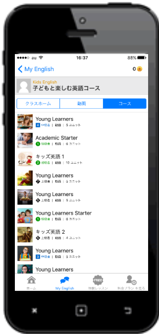
豊富なキッズ向けコース

また、学校教育の変化に伴い子どもを持つ親の意識も大きく変化しており、幼少期からの英語教育に対するニーズは年々高まっています。こうしたニーズに合わせて、全国 200 校以上の大学・高校・中学・小学校での英語 e-learning 教材の採用実績を持つイングリッシュセントラルでも、子供向けのコンテンツや専用コースを豊富に取りそろえています。